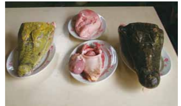
血淋淋的屍首是保育教育的素材嗎？

環境教育為提升民眾整體環境意識之立意良善，但以環境教育為招牌，實際卻是不人道並危害環境的教學場域或素材，是不該再被姑息的。提供更多的專業教育，是提升民眾意識的治本之道；也唯有透過民眾的自覺，產生消費者的篩選力量，進一步影響業者改善劣質的教育場所與素材，如此一來才可以達到制訂環境教育法的美意。