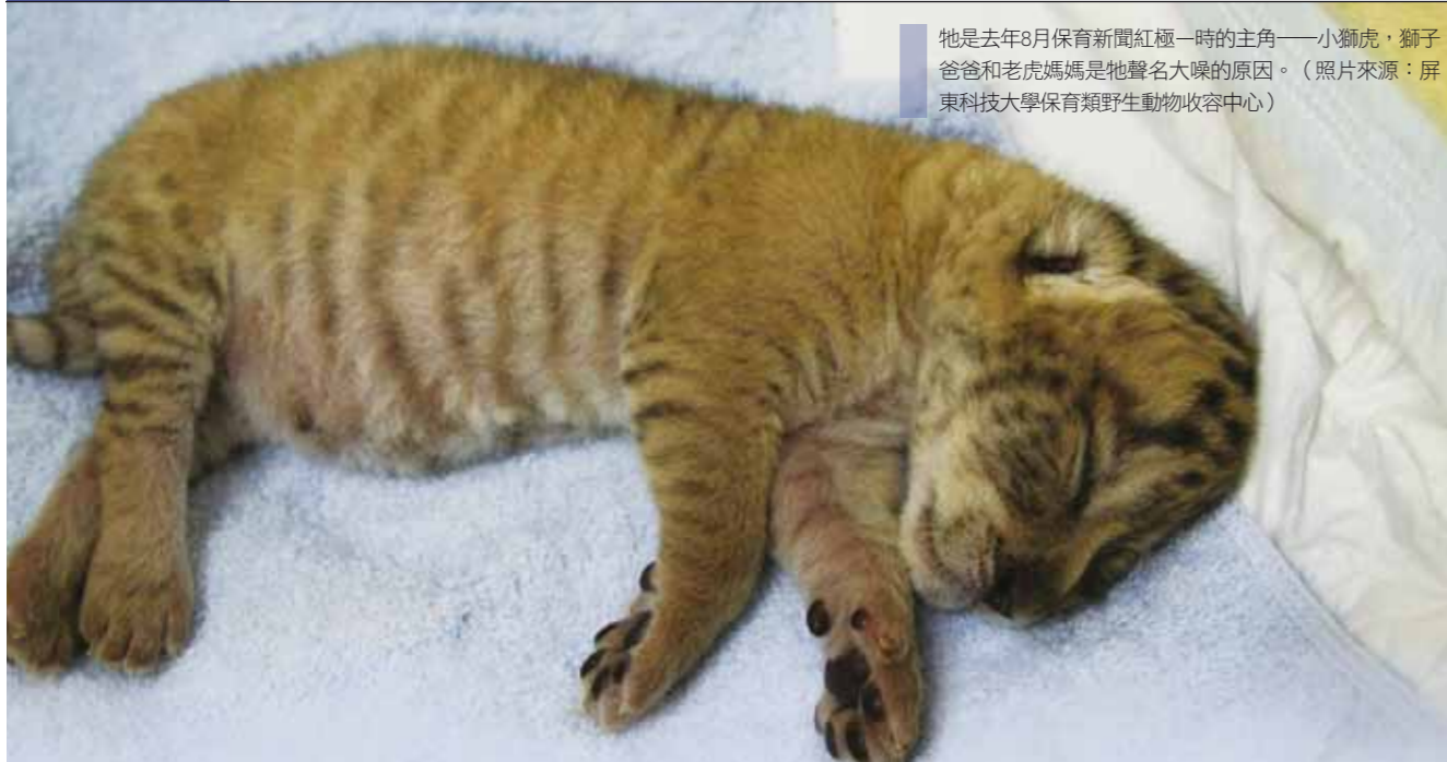
牠是去年8月保育新聞紅極一時的主角——小獅虎，獅子爸爸和老虎媽媽是牠聲名大噪的原因。