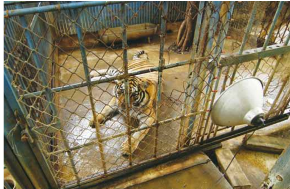
所謂的休閒農場，只是將動物囚禁在空洞的牢籠內任人觀看，被圈養的動物在狹小、四方單調的水泥室內，無聊、抑鬱，甚至緊迫焦慮終其一生，只為了人類有意無心的一眼。圖為小獅虎的母親。