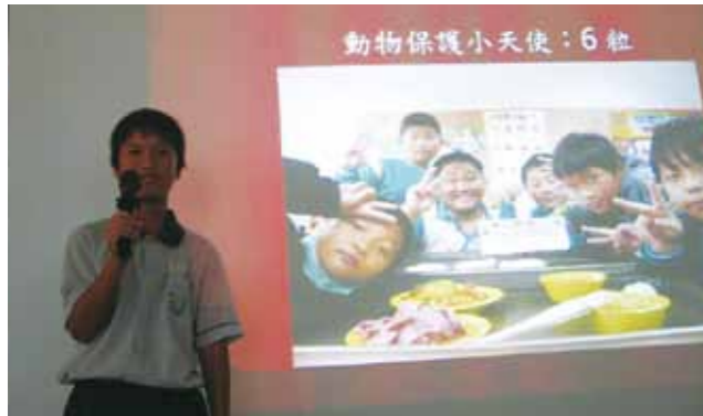
經過一次又一次的練習他們才敢站上講台