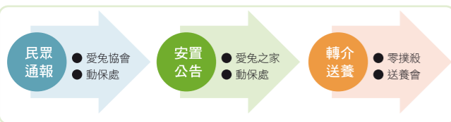
台北市政府與台北市愛兔協會的雙軌救援安置系統建置圖。

在動物保護的第一級工作上，為了更快速發現被棄養及被飼主虐待（通常是缺乏飼養知識的不當飼養）的寵物兔，提升當前寵物兔的動物福利與保護工作，台北市率先與台北市愛兔協會建立了一套跨單位的雙通報救援系統，透過民眾自發性的通報（可撥打台北市市民熱線 1999或是台北市愛兔協會值班客服手機），無論是棄兔救援或是不當飼養（疑似動物虐待案件），均由動物保護處動物救援隊進行介入處理，並帶回動物保護處與犬貓進行分離安置與公告，依法公告期結束後仍未獲民眾認養的寵物兔，將轉介由台北市愛兔協會進行長期的安置與後續送養工作，達到零撲殺的政策。