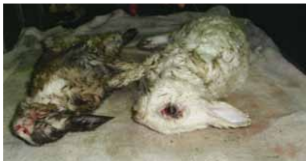
棄養行為等同於殺生（2010/10木柵救援案，兔兔在被放生五小時內遭攻擊死亡）。