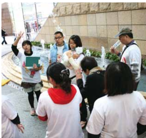
送養會前的志工提醒與教交代。

當然，還是希望想要飼養寵物兔的大家，能多多參加動物保護團體所舉辦的認養會，以認養取代購買，也可遏止不肖商人為了高單價的特殊品種而使寵物近親繁殖，導致寵物兔的基因疾病，也可以讓被棄養的寵物兔能再度擁有一個愛他的主人及家庭，願各位兔年都能事事順心，揚眉兔氣！