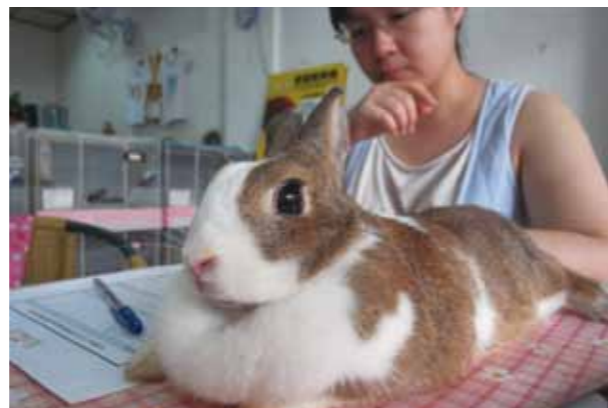
面談審核機制是對兔兔的一層保障。

認養人審核制度的建立，要同時兼顧審查的嚴謹以及認養人的感受。過度嚴謹的身家調查會讓認養人感受威脅，降低認養意願，延遲寵物兔接受認養的速度，但是過度鬆散的認養審查，又不能有效的過濾不合適認養人。目前針對寵物兔的認養人審核，多數包含以下指標：個人經濟能力、居住環境、家人支持意願等，其中各項指標所衍生的問卷題目就看每個愛兔動保單位的政策，有些會要求居家訪視，有些則希望在外租屋者出示房東的同意飼養書。