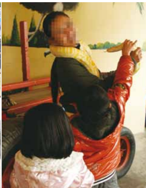
讓孩童任意玩弄蟒蛇是危險的。