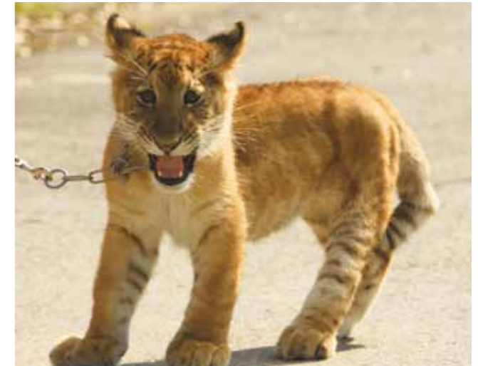
每日照養人員會挑選適合的時段，和小獅虎在園區內散步。每每看見牠那貓科動物特有的、野性又優雅的臉龐，總令人喜悅，然而在那引人的輪廓之後，S型的脊椎、僵直的左後肢、微微跳躍的步伐，便將臉上的微笑牽動至深沉的心痛，提醒著「由於人類的無知、好奇與自私，原本應被祝福的生命，將殘缺甚至痛苦地度過未來的所有歲月。」

其次，由於小獅虎只能在平面空間活動，在籠舍的設計上，無法像中心其他正常動物的籠舍一般，利用三度空間的設計增加活動的空間；尤其，不良於行的因素，相對於其他同年齡的貓科動物，小獅虎的活動量較少，除了不太愛走動，更加無法跑跳，而左後肢無法有力支撐，也使得牠的排便不如正常個體一般順暢，因此，籠舍的平面面積就相當重要。同時，因為牠的左後肢會拖行，地面的材質必須柔軟以免過度摩擦產生傷口。另外，除了日常照養外，中心的工作人員總是儘可能提供豐富化設施以提升其他動物的生活品質，但小獅虎的身體狀況將無法適用正常貓科動物的豐富化設施。這些種種的問題都將在小獅虎的成長過程中一一浮現，也考驗著中心所能提供的資源和人力。