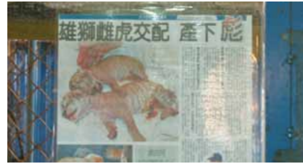
刻意產生自然界沒有的物種。

大部分的動物場所對於飼養的動物缺乏專業性。在場區中對於動物或生態的教育內容寥寥無幾，反而是杜撰一些非動物本性的錯誤資訊、誇大渲染動物的療效，或是標榜自家的特殊及專業。結果造成參觀者的誤信且以訛傳訛，更甚者常與媒體合作，透過媒體不斷的宣傳這些錯誤訊息，這樣產生錯誤教育的影響是無法估計的！甚至有飼主刻意將二種不同物種放在一起，想製造原自然界不會產生的品種，如：強迫獅子與老虎產生下一代，這樣的錯誤示範，不但會造成社會資源的浪費，也是錯誤的教育。