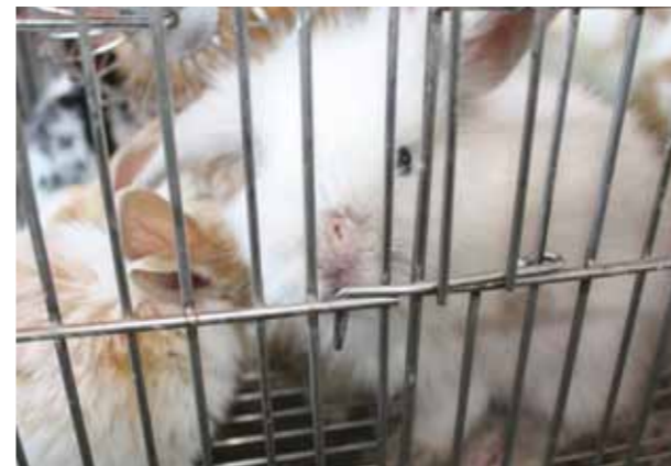
寵物兔生病店家通常不給予治療(疥癬)／右。

寵物兔的生育能力相當強，但政府對於寵物節育的補助卻僅限於狗、貓，使得寵物兔飼主必須要負擔較為昂貴的節育費用，使得多數飼主不願意為寵物兔進行節育，但是濫生的結果，卻又造成第二波的棄養，因此如果不能透過政府的節育補助做好源頭的控管，寵物兔棄養的問題將成為惡性循環。