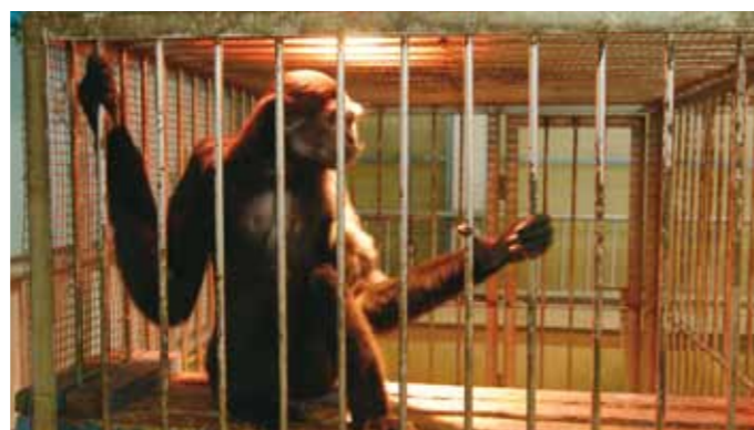
長臂猿因狹小的空間只能枯作而無法擺盪。