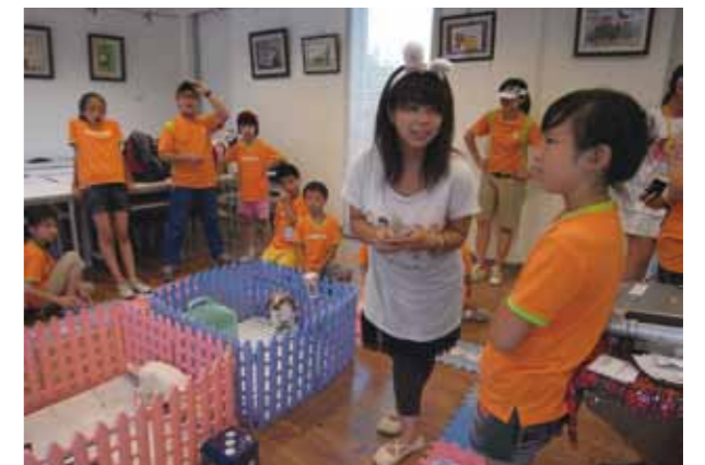
大兔子姐姐教室(上)、讓小朋友從小親近動物的課程(下)。