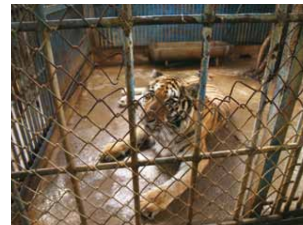
老虎籠舍年久失修，安全堪虞。

這些場所的動物圈養空間及活動範圍都過小。大多數動物被關在狹小簡陋的籠子，因活動空間過小及單調的環境，時常出現緊迫及刻板行為。另外，圈養環境的清潔及衛生狀況惡劣，動物的生活空間裡常見食物與排泄物混雜，甚至連參觀的空間也因狹小及簡陋而充滿腐臭的味道。再者，有些大型動物（如老虎、熊）的籠舍長年失修，安全性明顯不足。在如此劣質的環境下，動物的健康及疾病管理堪憂，且衛生條件與安全性也持續威脅參觀者。即使部分場所有廣大的場地，為了管理人員的方便，仍吝惜於供給動物更大的生活空間。