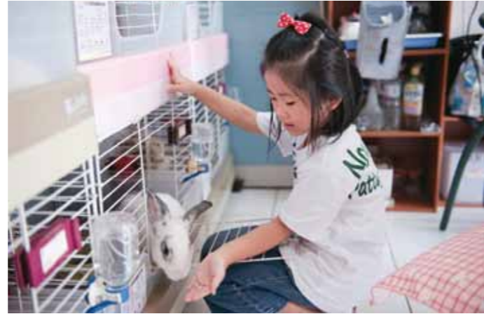
台北愛兔之家提供棄兔中長期照顧與送養。

的力量，解決長久以來官辦動物收容中心品質良莠不齊、寵物兔飼養知識不足的問題，也同時化解了民眾對於官方收容寵物兔是否進行安樂死的疑慮，確實達成「零撲殺」的政策。