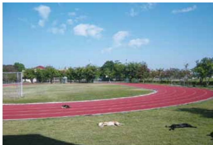
共享這一片藍天綠地。