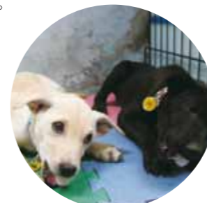
啃著牛皮骨的可愛模樣。