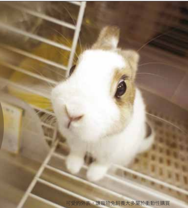
可愛的外表，讓寵物兔飼養大多屬於衝動性購買

2011年適逢建國百年，同時也是農曆的兔年。一時之間，可愛的兔寶寶成了大家注目的焦點，許多的家庭會添購兔子形狀的擺飾與商品，但也有人直接想要把活生生的兔子帶回家當成寵物；根據社團法人台北市愛兔協會過去的調查，目前在台灣飼養兔子的人口數量，在寵物界是僅次於飼養狗、貓的「第三勢力」，也就是說，在你我周遭的朋友，都可能曾經或是正在飼養兔子，隨著寵物商人、媒體的推波助瀾，這個數字比例相信會繼續攀高。