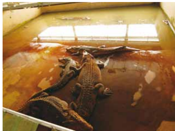
鱷魚終身在混著食物殘渣與排泄物的池子裡活動。