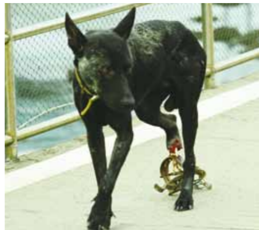
二年來，五股溼地仍可見到因捕獸鉗而受傷的浪犬。