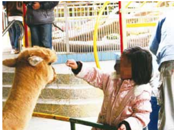
遊客餵食的食物可能不適合，另外，也可能因動物反應而讓遊客受傷。

慮，衛生也是一大問題。再者，動物也有其性情與脾氣，如果不小心引起動物發怒，民眾將陷於危險中，例如：被大象捲起、被蟒蛇勒緊、被鱷魚咬傷等等，都將造成可怕的後果。而為圖方便及營利，園方販售的餵食用食物是一種到底，也就是所有動物都餵一樣的「飼料」，不僅動物吃到不適合的食物，餵食的量也因遊客多寡而忽多忽少，不但造成動物營養不均，因食物量的不穩定還會引起消化系統的問題，以及動物搶食的行為，而動物搶食時也容易造成遊客的傷害。