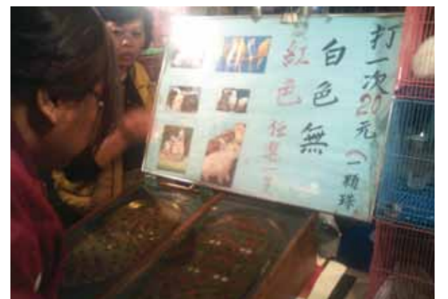
夜市常見的打彈珠送兔子遊戲(2010.07中壢夜市)。