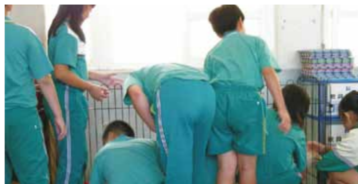
下課時總是圍著一群粉絲。