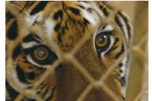
自幼被帶離自然的牠，是否回想著久遠以前有著母親依偎身旁的山林的氣味，或是在人類環境下出生的牠，流自祖先的野性依然會想像著專注於叢林密葉間的伏擊。

看到可愛的玩具或奇珍異獸？當我們讚嘆牠們的奇妙時，是否想過，為何以對待犯錯的人的方式，將牠們囚禁於方寸之間？當我們在圈養環境看到動物時，是快樂還是心痛，是否設身處地去了解牠們的感受？我們是否真正思考過，囚禁、利用、犧牲動物，是否是必要的？這些問題的答案，就在生活中用心的體會，這些問題的答案將決定許多動物的命運。