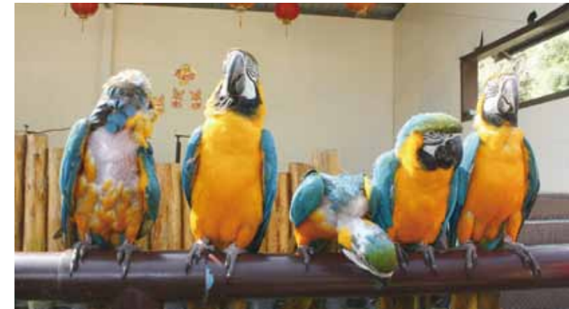
特技表演的藍黃金剛鸚鵡，出現胸口以及頭頸相連處沒有羽毛的情形，疑為啄毛症或遭較強勢的同伴攻擊。

觀眾的馬戲團失去市場之際，以鐵鍊限制獼猴行動、馱負數十名遊客的牛車、監禁於狹小空間的馬來熊，以及遭剪羽而無法飛翔的金剛鸚鵡等情況，卻仍散見台灣私人動物園與遊樂區。然而，動物非演員，訓練動物進行表演，我們起碼可以提出質疑如下：