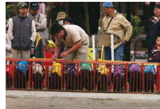
豬隻除了在槍響被放出來賽跑外，得一直被關在無法轉身的小籠子裡。