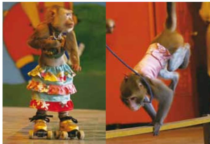
穿著秀服及溜冰鞋表演丑角，手還抓著造成脖子不舒服的「枷鎖」。