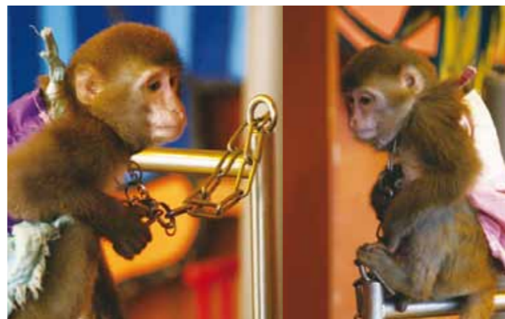
外來種的幼年獼猴。

台南地區五處戶外教學的熱門地點，都圈養著保育類野生動物。在調查中發現，有部分動物的年齡（幼年）及種類（外來種）皆令人質疑是否符合《野生動