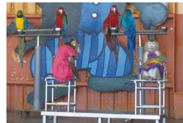
被要求表演的動物，一整天之中只能在僅有一張椅子大小的範圍內休息，也沒有攝取食物及飲水。