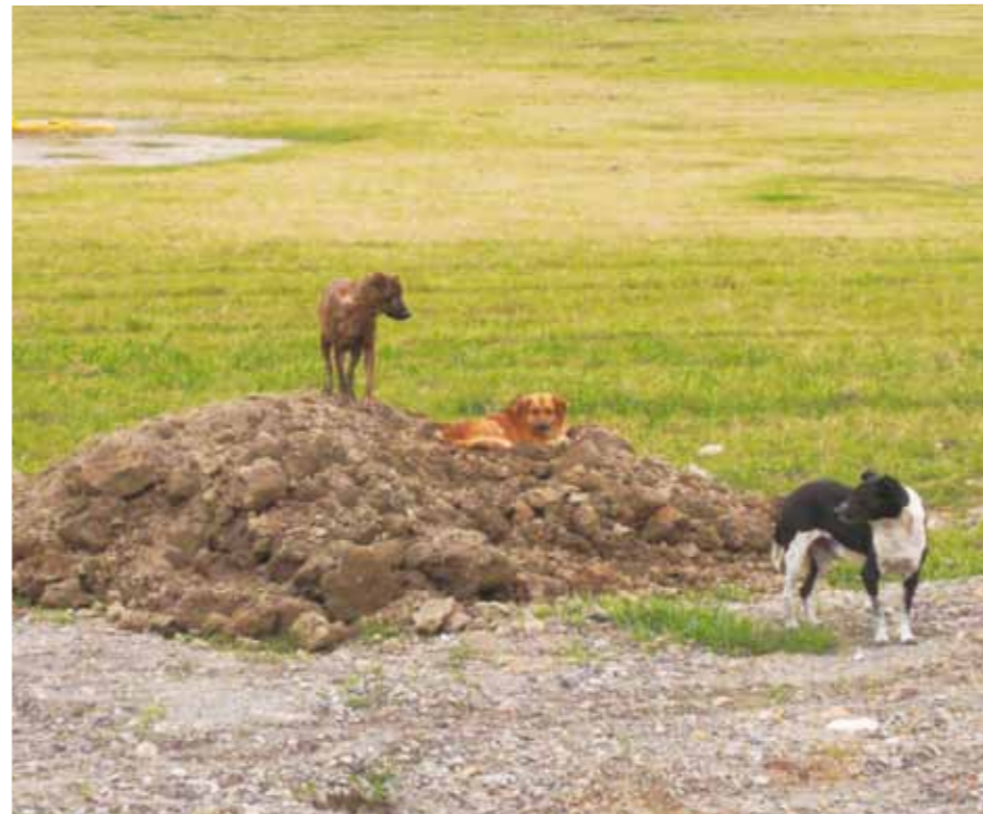
經關懷生命協會TNR志工一年多來的努力，五股溼地的母浪犬都已絕育。