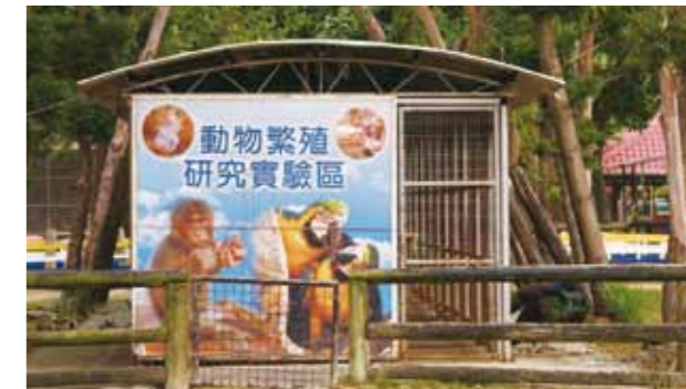
繁殖保育類動物之正當性、合法性令人存疑？

物保育法》的規範。如果這些教育場所持有的動物，合法性都令人質疑，如何能夠教育每年數千名前往參觀學生關於野生動物的保育知識？更甚者，野生動物走私的問題是否也因而被忽略？