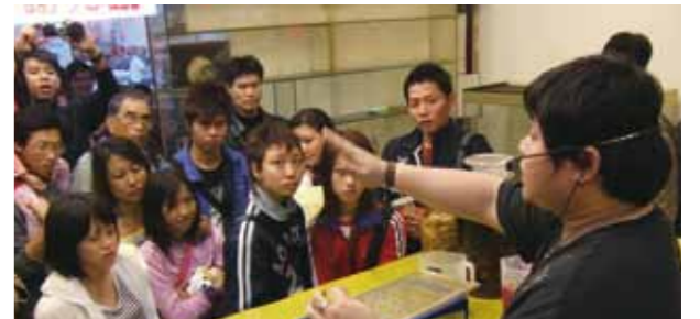
鼠兔活體餵食秀(華西街)。

寵物兔的議題除了棄養之外，還有整個社會的價值觀偏差的問題，例如實驗室管制不當造成實驗兔外流與棄置、小學自然課生物觀察飼養課程結束後遺棄、寵物店不當飼養、觀光農場兔展覽環境問題、夜市打彈珠送兔子問題、私宰肉兔衛生問題、宗教團體隨意購買肉兔放生、以活體作為展覽號招的