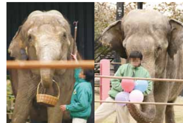
為了控制大象，工作人員拿的「指揮棒」是二邊有尖鉤的鐵器。

幕後被製造來接棒的新生兒，以及不知被送往何處的超齡個體。試想有多少無辜的生命是為了不具教育意義的動物表演而犧牲？用這種素材來教育我們的下一代，還能期望他們會尊重生命嗎？