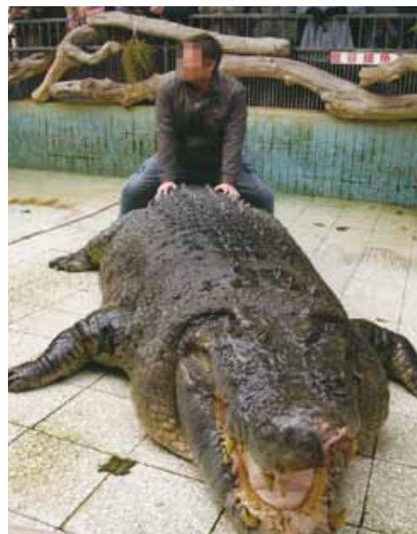
誤讓民眾以為鱷魚是溫馴的動物，可以騎乘，是不正確的觀念。