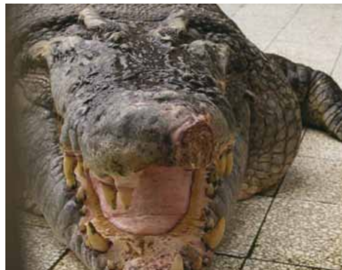
鱷魚吻部因活動空間不足撞傷，傷口長期未癒合。