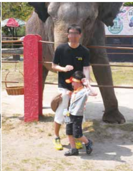
孩童心懷恐懼，被迫與大型動物拍照，易造成對動物的負面印象。