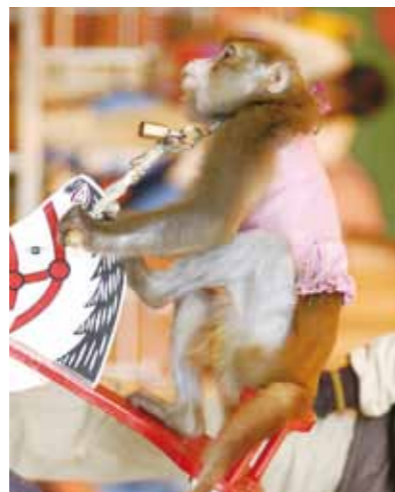
幼小的獼猴頸部被鐵鍊及鎖頭牽制著，常常一動就被勒住。

謔方式餵食不當的食物，即使有工作人員在場，非但不制止甚至加入玩弄動物的行列。這樣的照養條件下，園區裡許多動物的個體健康狀況明顯極差，連基本的生活條件都如此不堪，更遑論動物福利及動物權。