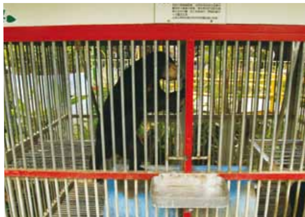
馬來熊在狹小的空間裡一直重複刻板行為。