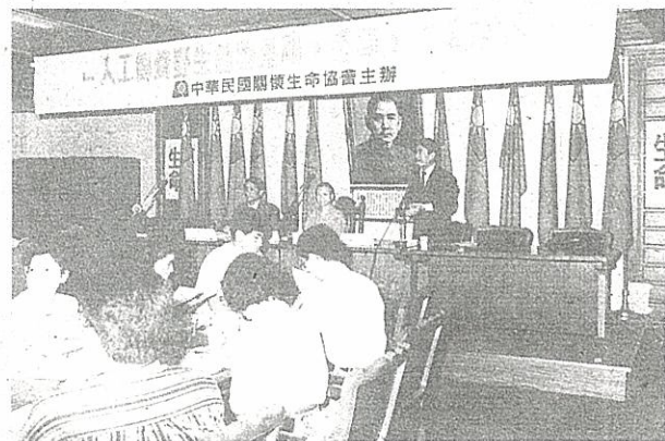
● 學者、專家、律師、立法委員、保育團體和宗教界，則以行動反對開放人工飼養野生動物。

另擬「人工飼養野生動物管理辦法」，助長非法方式造成事實之行為，取得正當法源，甚且聲稱雖原屬保育類野生動物，但因飼養繁殖成功其數量大增，應可將此等野生動物從保育類名錄中降級為一般類，甚且不反對成經濟類，可供百姓「利用」，此種作為不只違背母法之立法意旨與精