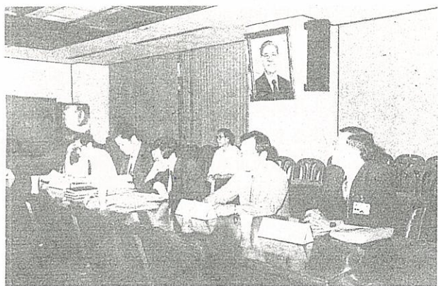
● 農委會、衛生署、環保署官員列席公聽會：口頭上沒人贊成開放人工飼養野生動物！