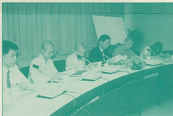
● 5月7日拜訪農委會，以了解該會組織工作計劃並促請改善經濟動物苦難