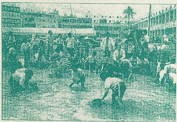
△高雄縣大樹鄉昨於大樹國小舉辦的「假日文化廣場」中充滿童趣的「捉泥鰍」比賽。