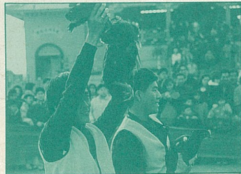
●「趕得雞飛狗跳，人們開心笑笑」文化季現場展示所捕獲的春雞

◎林建隆 去冬選舉 不再斬雞 今春文化季 依舊抓你 須知驚惶之不必亂竄之不必 君不見螢光幕上官員的解析？ 抓雞只是一種遊戲 遊戲則與文化一體 須知哀啼之不必控訴之不必 君不見東洋使劍的國度 背負暗箭的水鴨 兩腳拚命的划出 最後一口沉重的氣？ 須知心酸之不必怨恨之不必 君不見得道高僧正為你主持正義？ 人為口腹私慾難免食雞殺雞 然應當懷愧疚感恩之意 須知戒備之不必逃避之不必 君不見環保學者正為你爭取權利？ 讓雞活得像雞 運送屠宰過程應予人道處理 須知趣生之不必畏死之不必 君不見腰斬血書慘況 凌遲三千五百刀的酷刑已成過去？ 須知生肖之不必雞年之不必 獨立的姿勢留給人擺 報曉的工作鬧鐘替代 去吧！雞！去！ 明年文化季 不再抓你