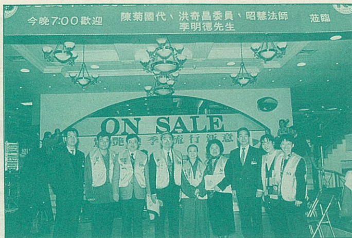
● 3月2日支援反雛妓募款活動