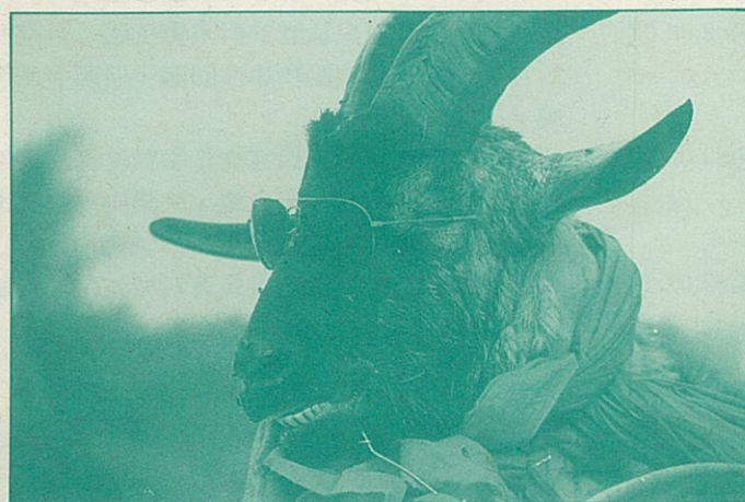
●拿生命開玩笑不是人類的幽默，而是悲心的失落！