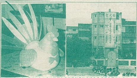
土城鄉運動會場的文藝台，別開生面借用新蓋的五層房子頂樓為場地。(石) 昨晚的抓春雞活動於熱鬧健康。

【記者黃福順／土城報導】土城鄉第十七屆運動會，昨日在土城鄉體育會舉行，活動內容豐富，包括土風舞、雷射舞會、抓春雞大賽等，現場氣氛熱烈，充滿喜樂。