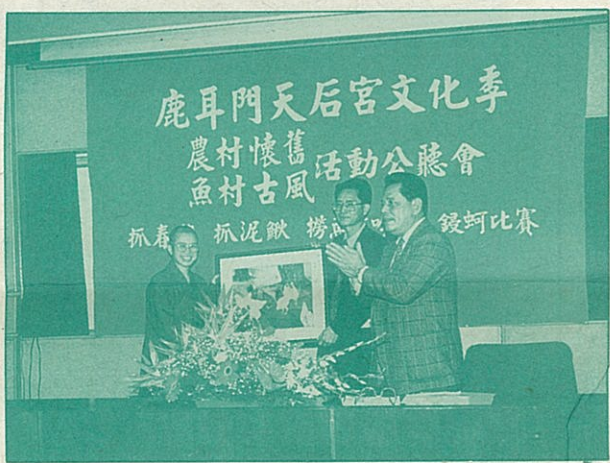
● 3月20日公聽會中本會贈送紀念品予主辦單位