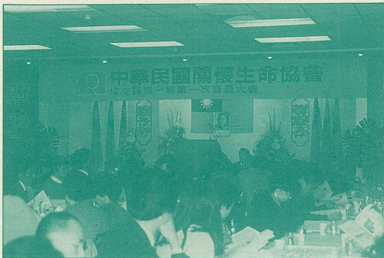
● 1月16日協會成立暨第一次會員大會現場