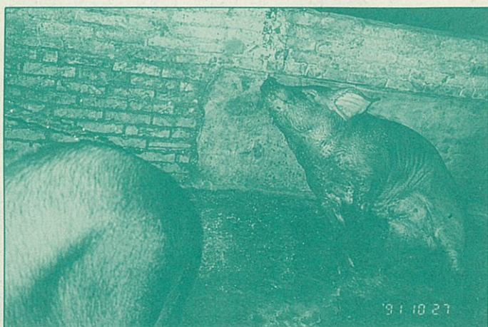
●「誰知盤中肉，片片皆殘酷」請大家告訴大家拒吃殘忍不人道的人工屠宰溫體肉。